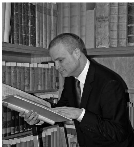
ARNOLD F. RUSCH*

Die Dokumentation über die Festnahme des Golden State Killers zeigt Anwendungsfelder modernster Kriminaltechnik, die auch schon hierzulande Anwendung gefunden haben.