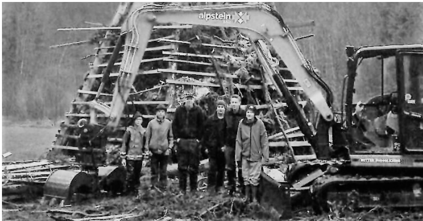
Mit Christbäumen und unbehandeltem Holz, das von Landwirten zur Verfügung gestellt wird, füllten die «Funkebeue» von Schwende das Lattengerüst auf.